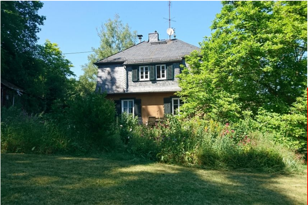
Garten im Sommer